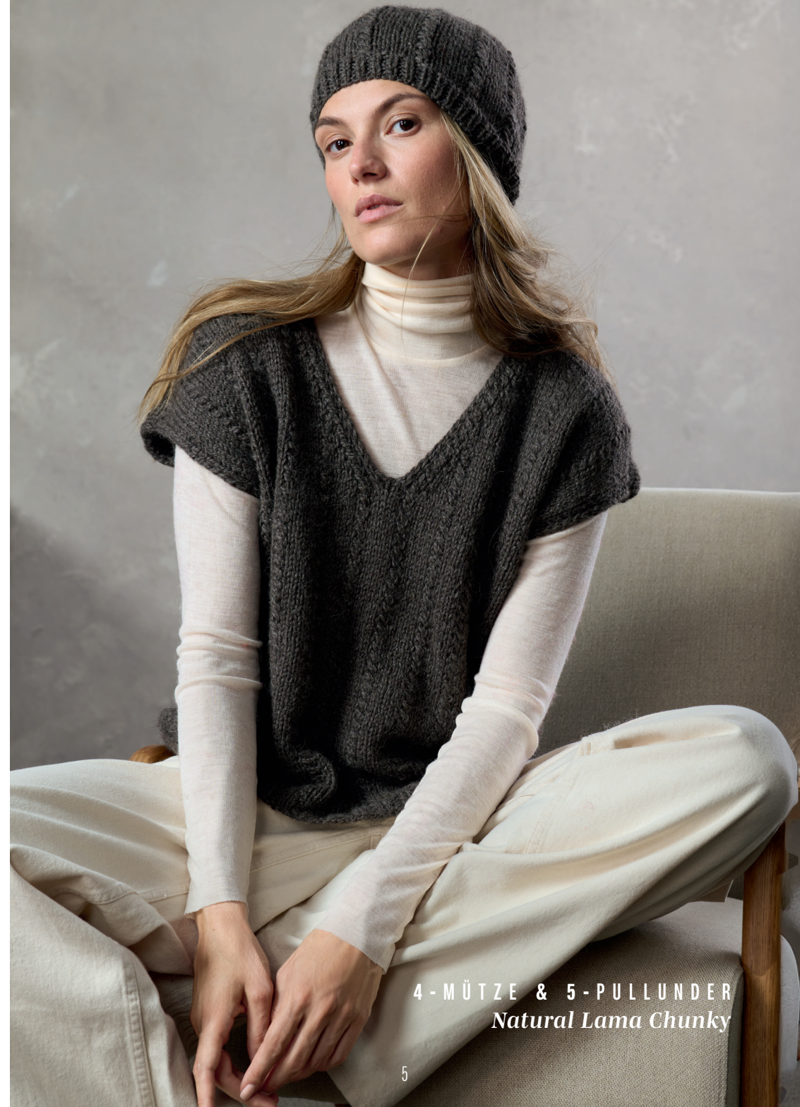
4 - MÜTZE & 5 - PULLUNDER Natural Lama Chunky